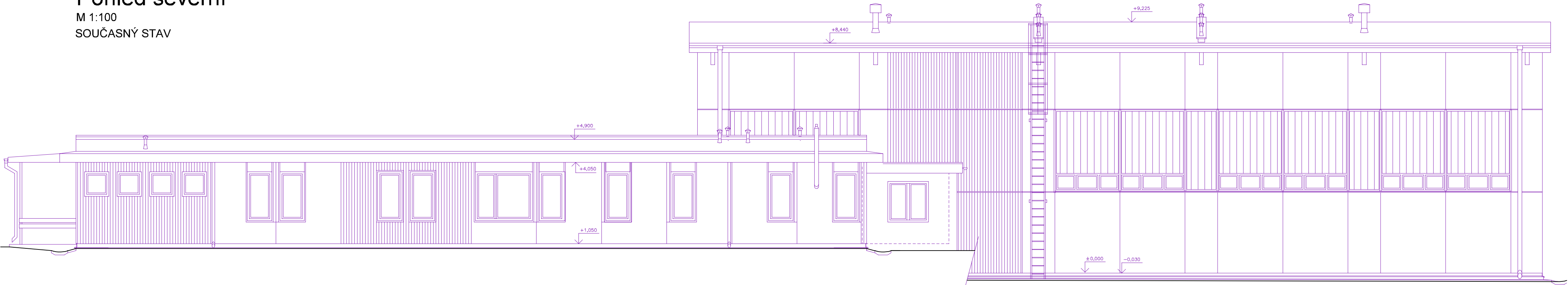
Pohled severní M 1:100 SOUČASNÝ STAV